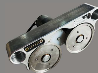
Cutter for Vinyl