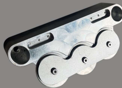
Cutter for Soft-board