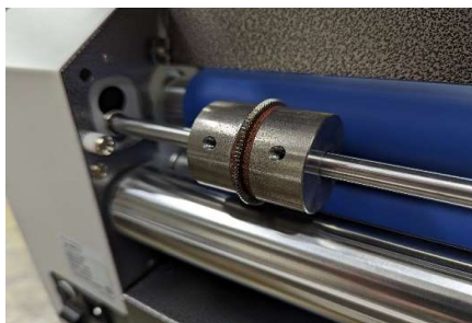
※パーフォレーター(GDRRC720)