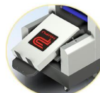
Automatic paper processor